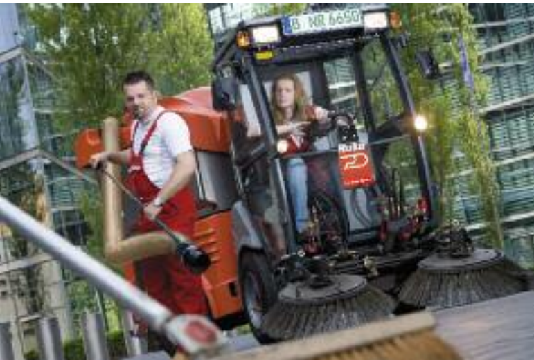
Titelbild: Ausstellungshalle des Deutsch-Historischen-Museums I. M. Pei, Berlin-Mitte

Mit Dussmann-Service haben Sie nicht nur einen kompetenten, sondern auch innovativen Partner an Ihrer Seite. So haben wir zum Beispiel KLIEN entwickelt – das Dussmann-Service Reinigungskonzept der besonderen Art. KLIEN orientiert sich an der Nutzung der einzelnen Flächen. Mit einer umfassenden Bedarfsanalyse ermitteln wir, wo welcher Reinigungsaufwand benötigt wird. Ihre Haupturlaubszeiten werden dabei genauso berücksichtigt wie ganz spezielle und aus Ihrer Sicht kritische Punkte der Reinigung von Individuallflächen. In einem besonderen Qualifizierungsprogramm trainieren unsere Mitarbeiter den „geschulten Blick“. Denn eine so anspruchsvolle und individuelle Reinigung ist nur möglich, wenn das Reinigungspersonal genau hinsieht.